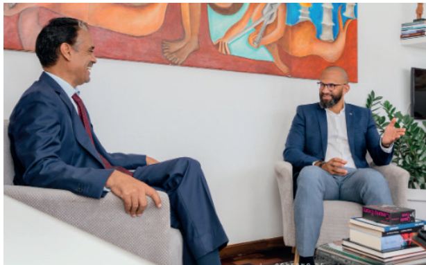
Le SP avec le Ministre de la peche du Cabo Verde Abraão Barbosa Vicente

Après sa prise de fonction le Secrétaire Permanent a effectué une tournée de prise de contact avec tous les Ministres en charge de la pêche des États membres pour requérir leurs avis sur les orientations souhaitées par les Etats membre dans le domaine des pêches et de l'aquaculture.