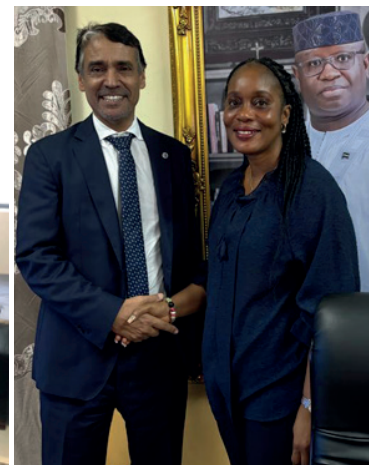
Le SP avec le Ministre de la peche de la Sierra Leone Princess Dugba