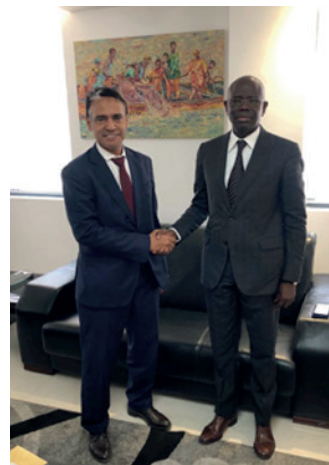
Le SP avec le Ministre de la peche du Sénégal Papa Sagna MBAYE