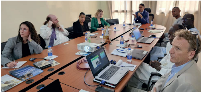
Réunion avec la délégation de la Millenium Challenge Cooperation

Visite le 15 septembre 2023 d'une délégation du Millenium Challenge Corporation à la CSRP pour discuter des possibilités de collaboration autour d'un projet sur l'économie bleue.