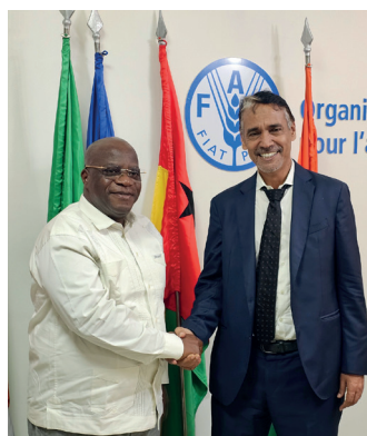
Le SP avec le coordonnateur régional de la FAO résidant à dakar