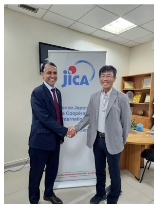
Le SP avec le représentant résident de la JICA à dakar