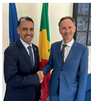
Le SP avec l'ambassadeur de l'union européenne à Dakar