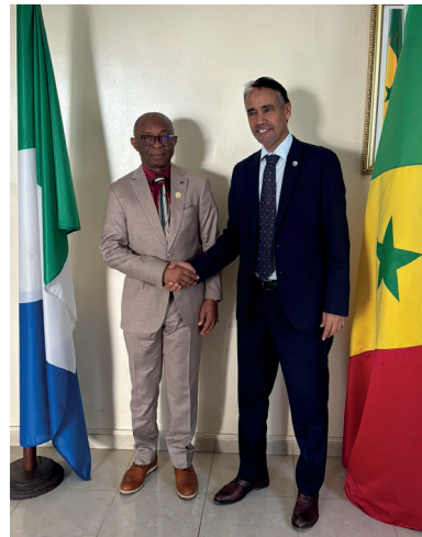
Rencontre avec l'Ambassadeur de la Sierra Leone au Sénégal