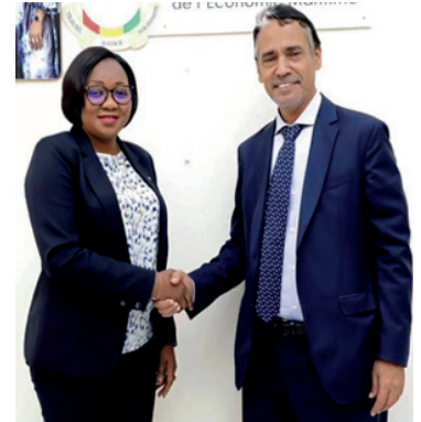
Le SP avec le Ministre de la peche de la Guinée Conakry Charlotte DAFTE