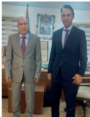
Le SP avec le Ministre de la peche de la Mauritanie Mohamed Abidine MAYIF