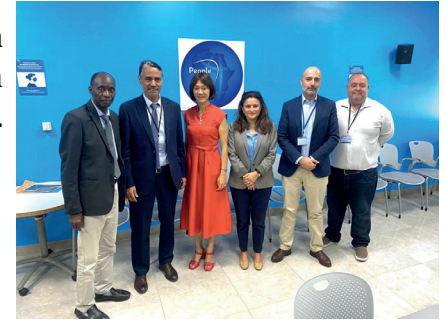
Rencontre avec la délégation de la Banque Mondiale au Sénégal

Visite le 15 septembre 2023 d'une délégation du Millenium Challenge Corporation à la CSRP pour discuter des possibilités de collaboration autour d'un projet sur l'économie bleue.