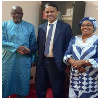
Le SP avec le Ministre de la peche de la Gambie Musa S. DRAMMEH